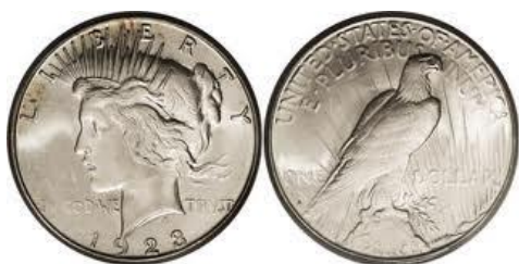
SILVER DOLLAR 1923

Mijn voorwerp is een zilveren dollar, 5 x met me meeverhuisd!