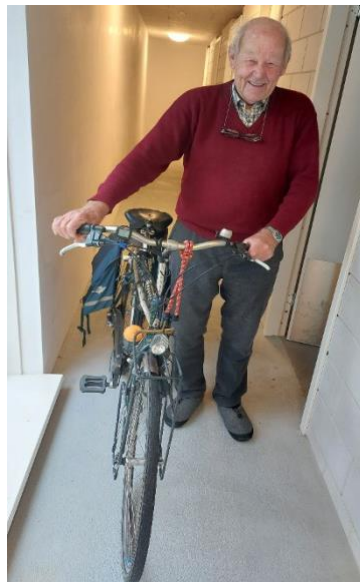
1 november 2023!

De fiets -Rein fietste er (o.a.!) ook nog eens 24(!) keer de Elfstedentocht mee!- is er nog steeds en bijna dagelijks in gebruik!